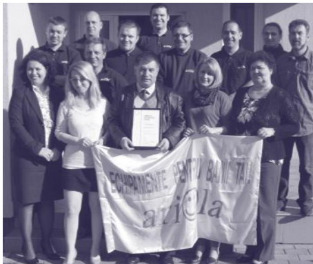
Dezvoltarea angajaților a dus la creșterea vânzărilor

Ținând cont că echipamentele trebuie verificate de 1-3 ori pe săptămână, departamentul de mentenanță este cel mai mare din companie, contribuind cu 30% la venituri și având cele mai mari marje de profit. Într-o piață dinamică în